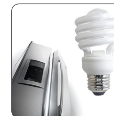
GE Appliances & Lighting