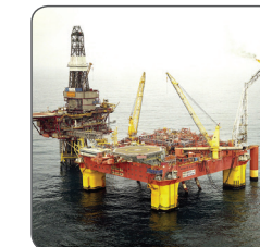
GE Oil & Gas