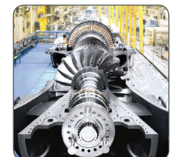
GE Power & Water