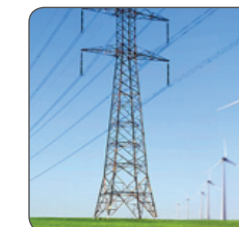
GE Energy Management